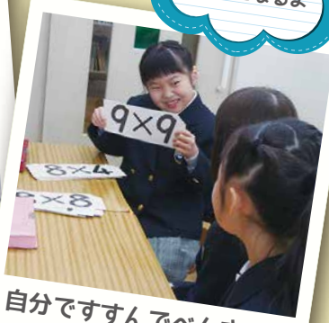
自分ですんでべんきょう するから楽しい！