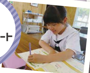
宿題は学童で やっちゃおう♪