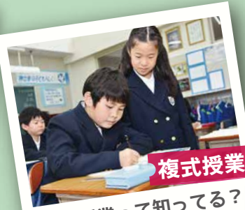
複式授業 複式授業って知ってる？ 私たちの授業のようすを、 ぜひ見に来てね！