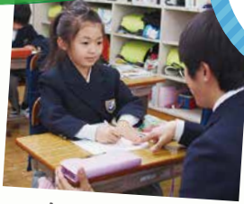
気軽にたくさん 質問できるよ！