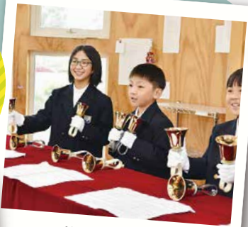
ハンドベルの キレイな音色がだいすき