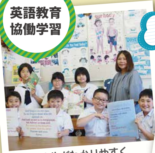
先生がわかりやすく おしえてくれるよ！ I'm fine, thank you!