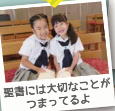
聖書には大切なことが つまってるよ