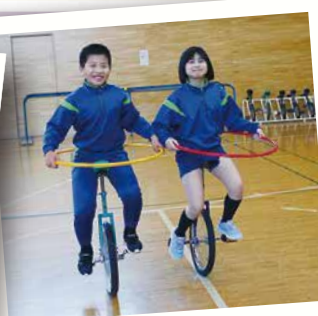
友だちといっしょに乗る 一輪車は楽しい!!